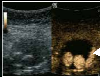
Endoleak Typ Ib

SONOVUE® - Pulver und Lösungsmittel zur Herstellung einer Dispersion zur Injektion. Wirkstoff: Schwefelhexafluorid-Mikrobläschen. Zusammensetzung: Arzneilich wirksame Bestandteile: Schwefelhexafluorid, nach Rekonstitution gemäß Anleitung enthält 1 ml der fertigen Dispersion 8 µl Schwefelhexafluorid in den Mikrobläschen. Sonstige Bestandteile: Pulver: Macrogol 4000, Distearoylphosphatidylcholin, Dipalmitoylphosphatidylglycerol-Natrium, Palmitinsäure. Lösungsmittel: 5 ml 0,9% w/v Kochsalzlösung für Injektionszwecke. Anwendungsbereiche: Lungengängiges Ultraschallkontrastmittel zur Anwendung in der Ultraschalldiagnostik, um die Echogenität des Blutes zu erhöhen und ein verbessertes Signal-zu-Rausch-Verhältnis zu erzielen. Echokardiographie: Verbesserung der Sichtbarkeit der Herzkammern sowie der Endokardabgrenzung bei kardiovaskulären Erkrankungen. Makrogefäßsystem: Verbesserung der dopplersonographischen Diagnostik der zerebralen Arterien, der extrakraniellen Carotis, der peripheren Arterien und der Portalvene. Mikrogefäßsystem: Verbesserte Darstellung der Vaskularisierung lokaler Läsionen und damit einer spezifischeren Charakterisierung von Läsionen der Leber und der